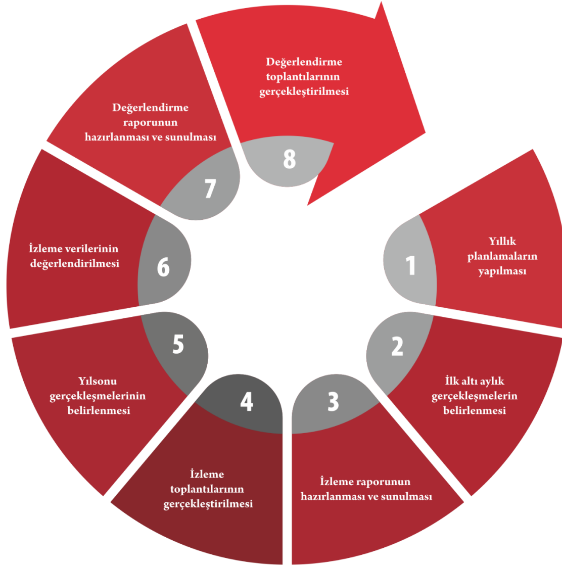
Şekil 2. İzleme Değerlendirme Süreci